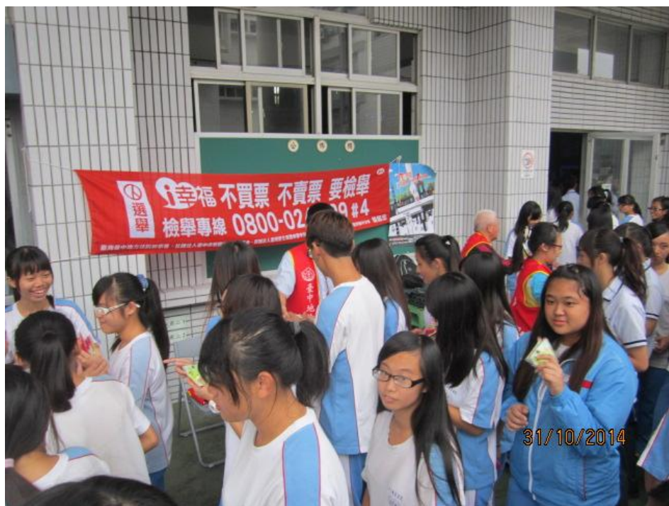
設攤懸掛反賄選紅布條及海報