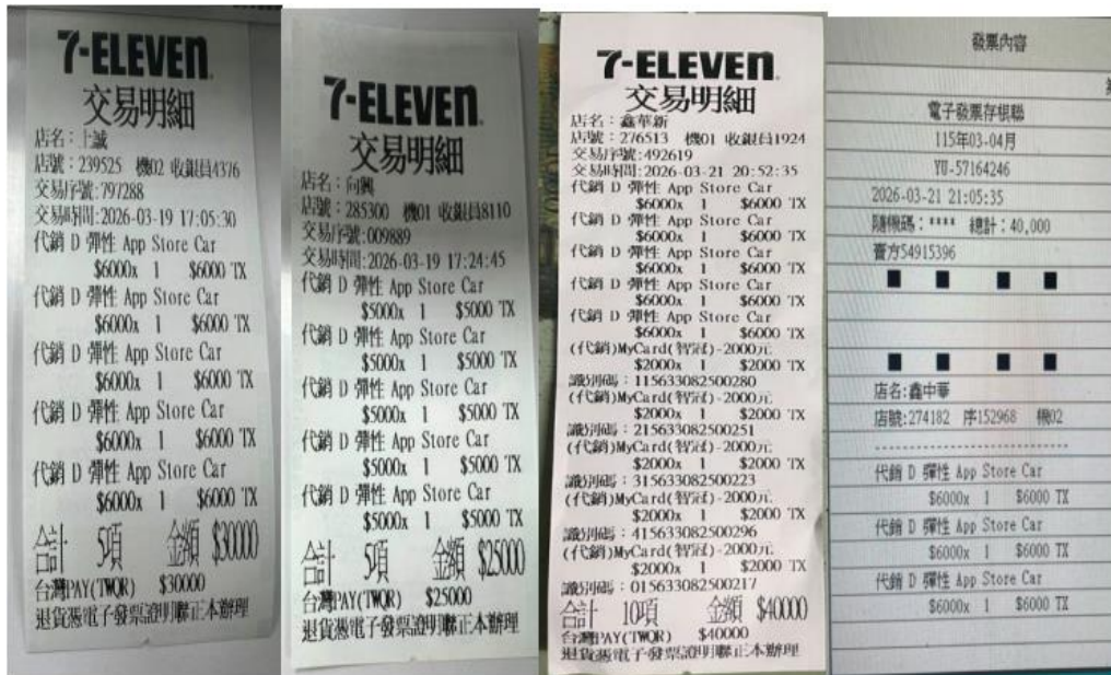
▲吳嫌持QR Code付款碼消費購買apple store點數交易明細。