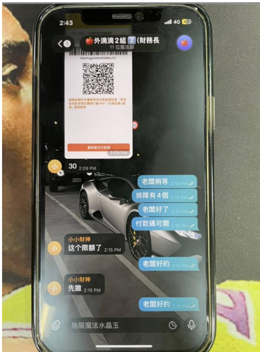
▲ 詐團傳送被害人之 QR Code 付款碼至車手工作手機。