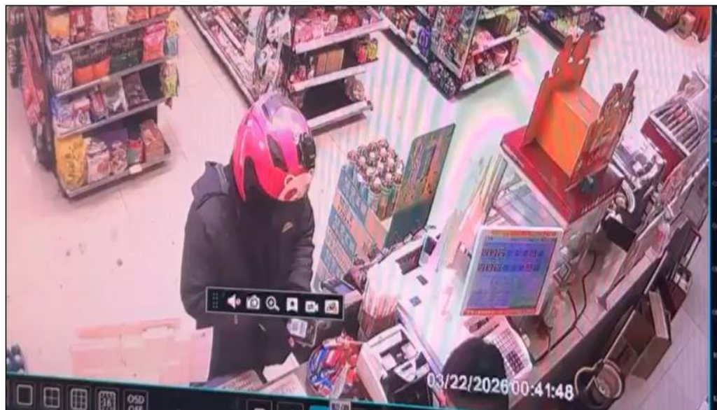
▲王嫌持QR Code付款碼消費影像。