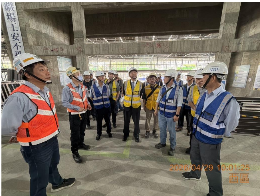
本署洪家原檢察長率員視導工地現場