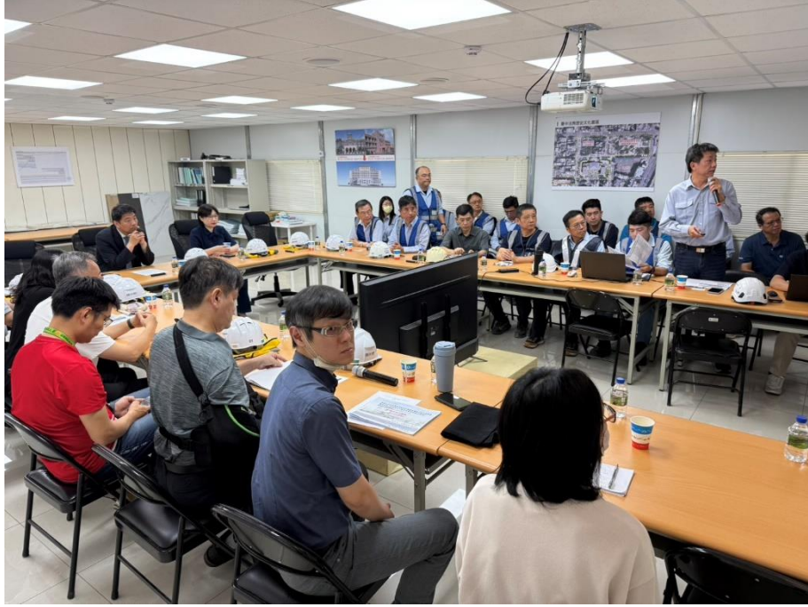
本署洪家原檢察長與施工團隊進行會議