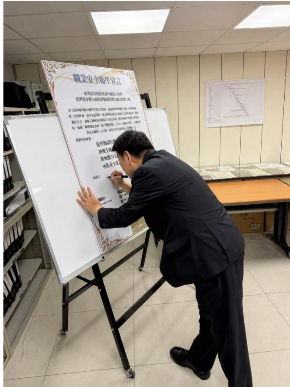
本署洪家原檢察長簽署「職業安全衛生宣言」