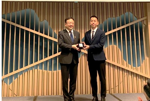
法務部常務次長馮成與郭遠檢察官合影