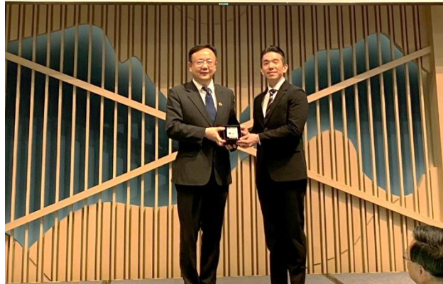
法務部常務次長馮成與張凱傑檢察官合影